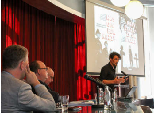
Voorstelling van het boek 'Was opa een nazi?' – 13.9.2017 - CegeSoma