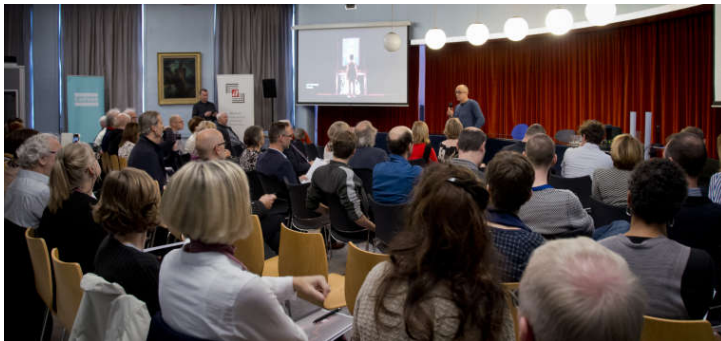
Voorstelling van de televisiereeks 'Kinderen van de collaboratie' (Canvas) - 24.10.2017 - CegeSoma