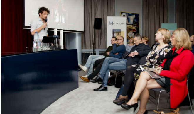
Voorstelling van de televisiereeks 'Kinderen van de collaboratie' (Canvas) - 24.10.2017 - CegeSoma

Het aantal wetenschappelijke, historische vragen blijft eveneens stijgen. Ons publiek is vandaag meer geïnformeerd dan ooit, en stelt vaak zeer gerichte vragen vanuit een nood aan een antwoord op maat.