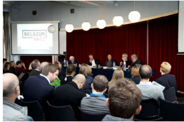
Lancering van het online platform Belgium WW II - 27.9.2017 - CegeSoma

Mogelijk de belangrijkste mijlpaal binnen het domein van publieksgeschiedenis, was de lancering van het online platform 'Belgium WW II' ( www.belgiumwwii.be ) op 27 september 2017. Het project startte in 2015 als een BRAIN-pioniersproject en werd ook mede gefinancierd door de Interuniversitaire Attractiepool (IUAP) 'Justice and Populations'. De site werd gelanceerd met twee grote uitgewerkte thema's: collaboratie en repressie enerzijds, en justitie anderzijds. Het doel van dit online platform is om bondige maar wetenschappelijk verantwoorde informatie te verschaffen over de geschiedenis van België tijdens en rond WO II. Een grote en diverse groep historici werd aangezocht om de inhoud hiervan aan te leveren. Het platform gebruikt vier verschillende ingangspunten (essentiële vragen, virtuele tentoonstellingen, de oorlogsportretten van bekende en onbekende mensen en de eigenlijke encyclopedie) zodat de gebruikers vanuit basisvragen steeds meer specifieke informatie kunnen zoeken. Eind 2017 telde de site 194 thematische artikelen, 70 biografieën, 75 chronologische bijdragen, 17 oorlogsportretten en 11 virtuele tentoonstellingen. De site is volledig tweetalig (een deel is zelfs in het Duits). De site telde vanaf de lancering tot begin 2018 meer dan 30.000 bezoeken.