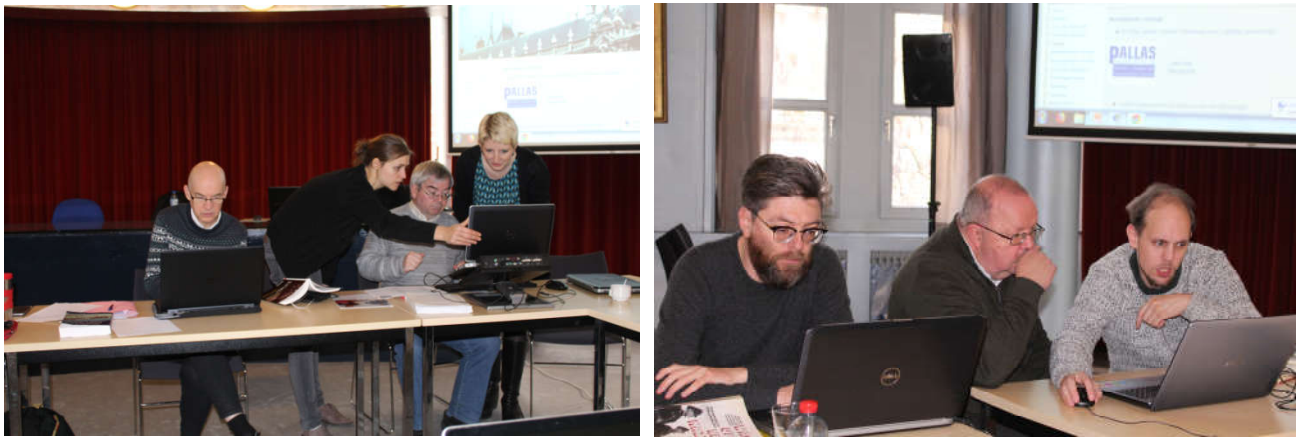
Dag Wikipedia – 18.12.2017 - CegeSoma

We organiseerden ook een Wikipedia dag op 18 december 2017, die niet enkel diende om de online verwijzingen naar de archieffondsen van het CegeSoma te verbeteren, maar ook om linken te creëren tussen de bijdragen over de WO II en de site Belgium WWII .