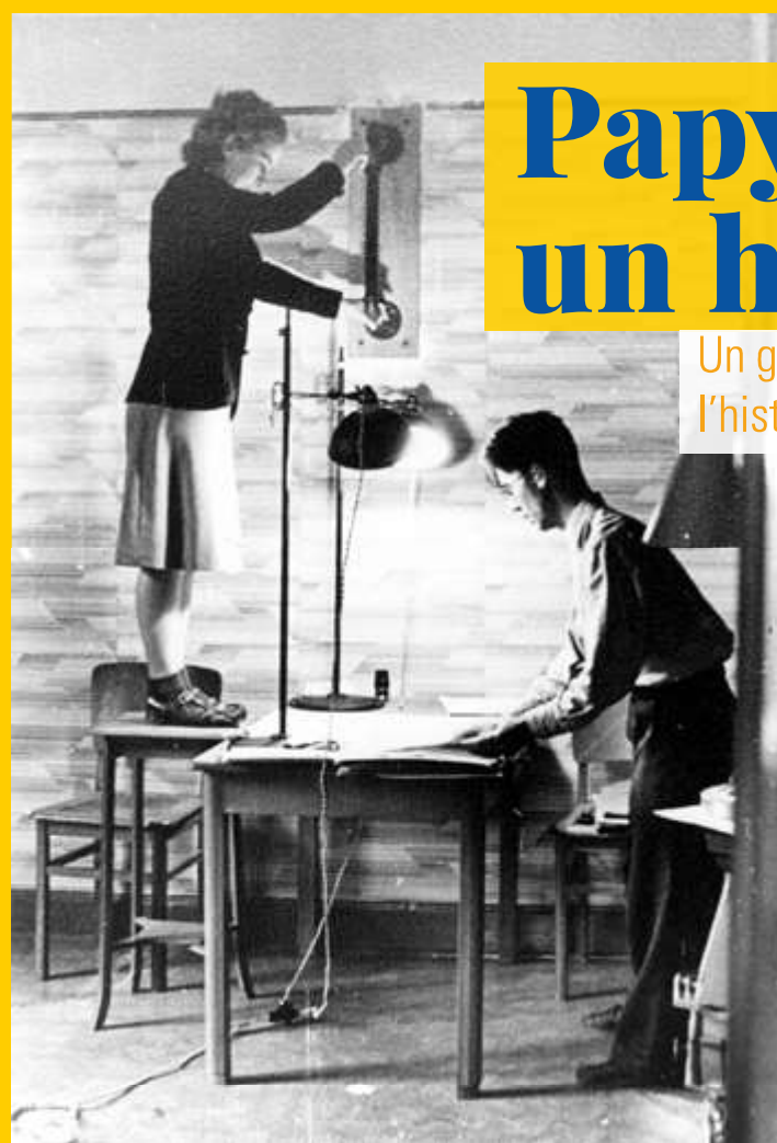
Photographie de documents du service de renseignements Mar avant leur envoi à Londres.

Fruit d'un travail collectif coordonné par le CegeSoma (la 4 ème Direction opérationnelle des Archives de l'État), ce livre fait le point sur l'histoire et la mémoire de la Résistance pendant la Seconde Guerre mondiale. Surtout, il propose de multiples pistes pour retrouver la trace des activités des dizaines de milliers de héros de ce combat sans merci contre l'occupant nazi.