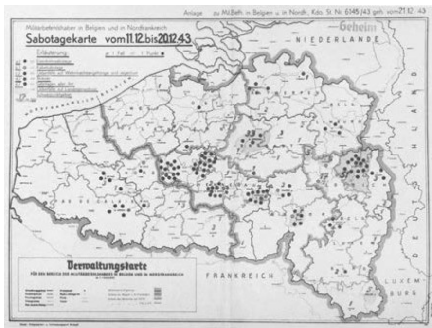
Carte allemande témoignant du nombre élevé de sabotages à Bruxelles et en Wallonie en décembre 1943. Cegesoma, archives de la Militärverwaltung, Kommandostab Ia, Tätigkeitsberichte (GRMA, T501, R96, 428). © Cegesoma

renseignements concourent également à la victoire finale. Par ailleurs, les chaînes d'évasion permettent à des milliers de personnes (soldats britanniques cachés dans le pays après la campagne de mai-juin 1940, aviateurs alliés dont l'engin a été abattu par la chasse allemande, agents envoyés en mission en Belgique, personnalités belges ou simples particuliers), de rejoindre l'Angleterre pour y poursuivre la lutte. Un grand nombre d'homicides parmi les 850 perpétrés sur les collaborateurs participent aussi à cette logique militaire en mettant fin aux agissements de dénonciateurs.