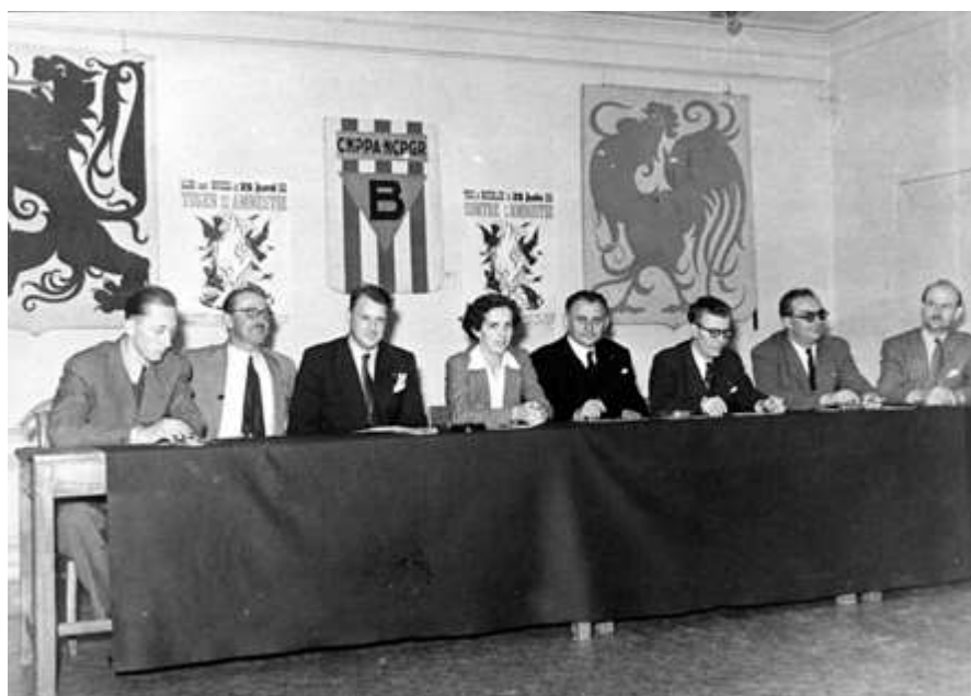
Les responsables de la Confédération nationale des prisonniers politiques et ayants droit témoignent de l'unité de leur organisation en pleine question royale, 1950. CegeSoma, photo n° 92029. © CegeSoma

Tout cela ressemble à la chronique d'une mort annoncée. Pourtant, depuis une dizaine d'années, l'intérêt pour l'histoire de la Résistance semble peu à peu progresser. C'est particulièrement le cas en Flandre où la montée de l'extrême droite pousse sans doute certains milieux politiques et intellectuels à stimuler l'étude d'un phénomène trop longtemps discrédité, puis oublié.