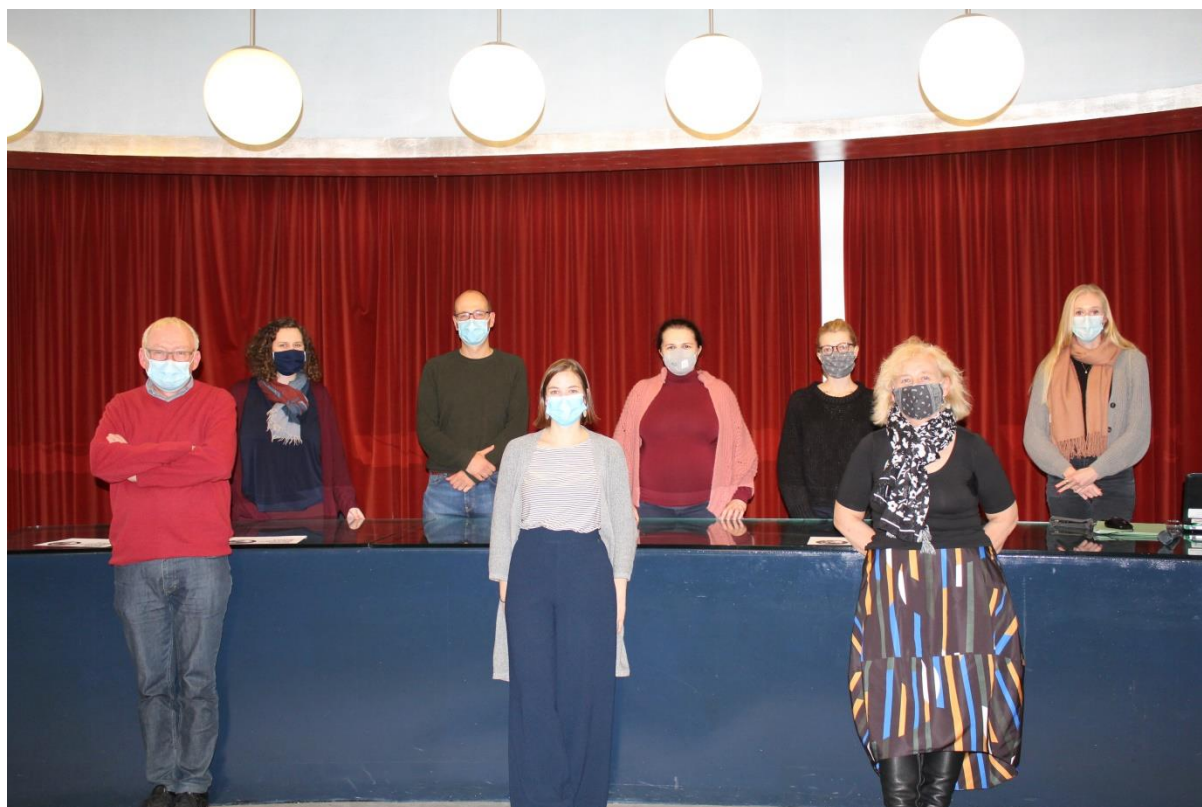
Présentation des projets en cours – CegeSoma - 19 octobre 2020

Le 19 octobre 2020, une grande partie de l'équipe s'est retrouvée pour une présentation des projets en cours, dans le respect des conditions sanitaires, dans la salle de conférence. Ce moment a été l'occasion de découvrir de nouveaux collègues que les circonstances actuelles ne nous avaient pas encore permis de rencontrer.