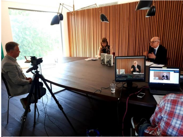
Webinaire - 28.5.2020 Studios éditions Lannoo, Tielt

Le guide constitue un jalon pour l'étude de la résistance en Belgique dans la mesure où il donne pour la toute première fois un aperçu général des archives très dispersées relatives à cette question en Belgique (et parfois à l'étranger), améliorant ainsi considérablement les possibilités de recherches pour les proches et les chercheurs. Dans le cadre de la prospection et des recherches menées pour ce guide, quelques nouveaux fonds ont d'ailleurs été découverts. Hélas, le livre a été publié peu après le confinement.