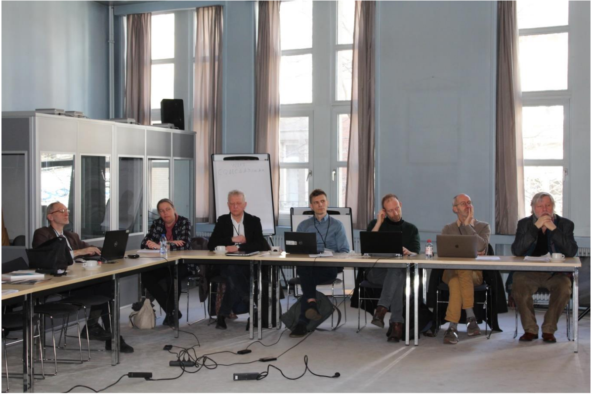
Workshop ' Cultures of Spectacle in Occupied Belgium : Parallels (1914-1945) ' - CegeSoma - 12 & 13 mars 2020