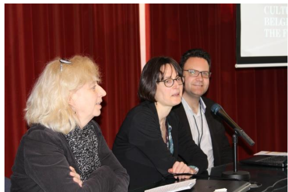
Workshop ' Cultures of Spectacle in Occupied Belgium : Parallels (1914-1945) ' - CegeSoma - 12 & 13 mars 2020

Ce workshop donnera d'ailleurs lieu à un numéro thématique de la Revue belge d'Histoire contemporaine qui sera publié après 2021.