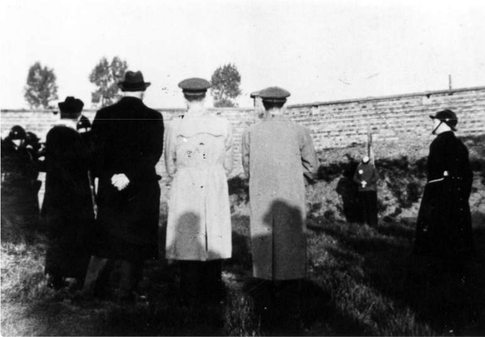
Terechtstelling, 1948