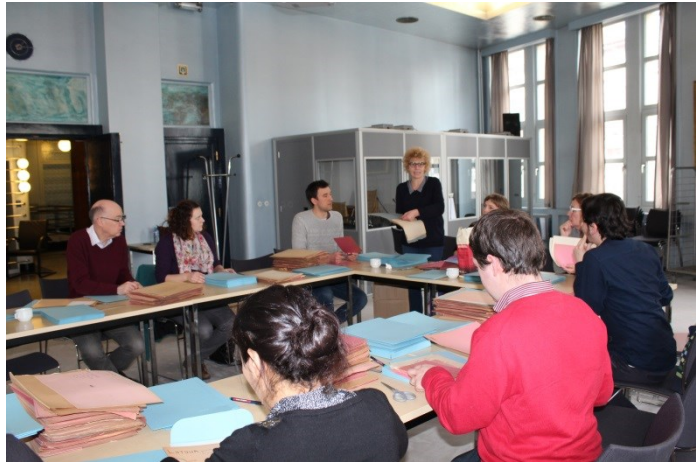
Un 'moment de reconditionnement' collectif- CegeSoma - 12.3.2018

La principale nouvelle acquisition concerne deux mètres linéaires d'archives de la 'Fraternelle du service de sabotage Hotton', un fonds composé essentiellement de dossiers de reconnaissance individuels d'après-guerre. En 2018, 1188 nouveaux titres sont venus compléter la bibliothèque du CegeSoma (921 nouveaux titres en 2017). Le nombre d'abonnements à des revues est passé à 33 (104 sous forme de prêts-échanges).