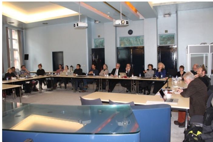
Atelier international : la fin des projets GWB et Memex – CegeSoma – 14.12.2018.