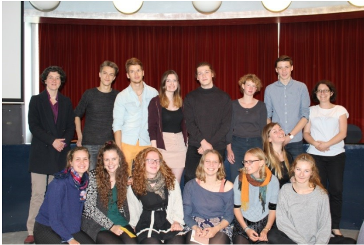
Événement de clôture ASF - CegeSoma - 19.6.2018

Friedensdienste (ASF) . Trente-cinq personnes y ont assisté. ASF a été fondée après la Seconde Guerre mondiale pour envoyer de jeunes volontaires allemands dans les pays où la population avait souffert des crimes nazis. Dans les pays concernés, ces jeunes allemands s'engagent dans des projets sociaux, culturels, éducatifs ou historiques. Depuis 2009, le CegeSoma est un de ces établissements d'accueil.