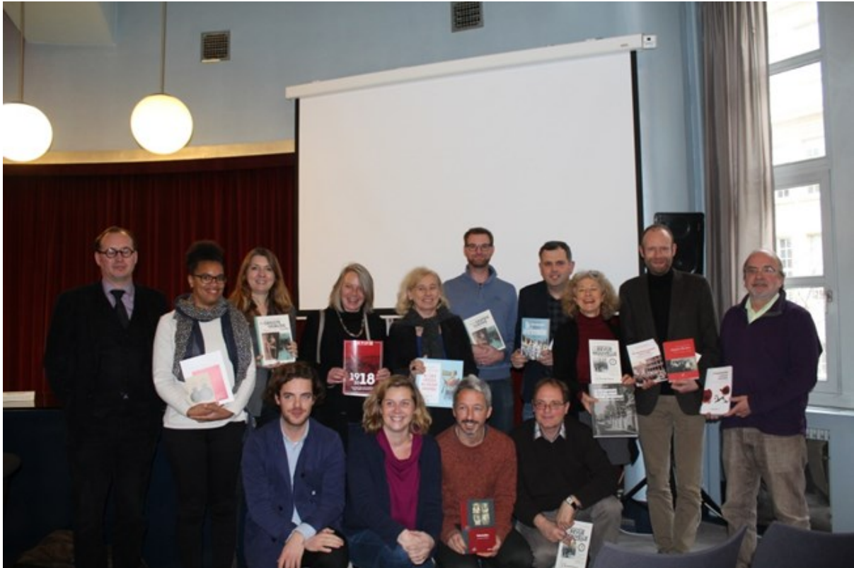
Publications sur la « Grande Guerre » à la fin des commémorations. Bilan et perspectives - CegeSoma - 19.11.2018