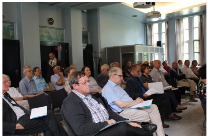
Journée pour les cercles francophones d'histoire locale – CegeSoma - 11.6.2018

Le 19 juin nous avons co-organisé l'événement de clôture d' Aktion Sühnezeichen