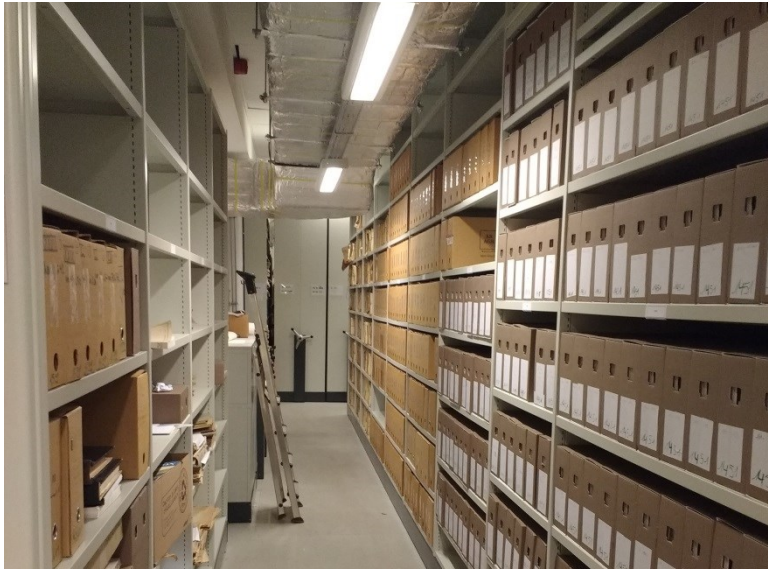
Le dépôt Belgrade à Forest - 2018