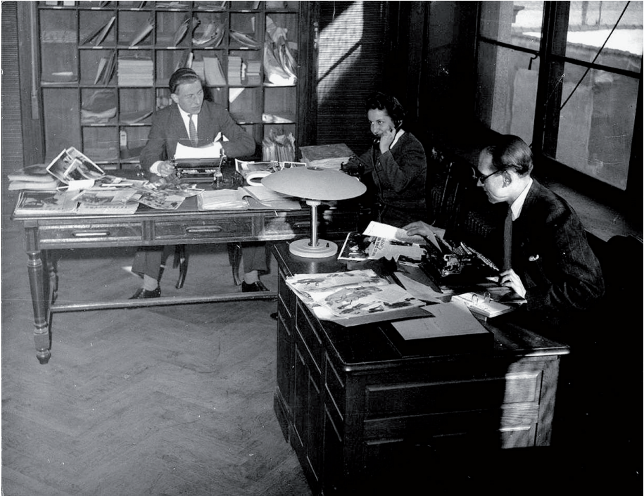
• Bedrijvigheid op de redactie van een geïllustreerd blad in 1944.