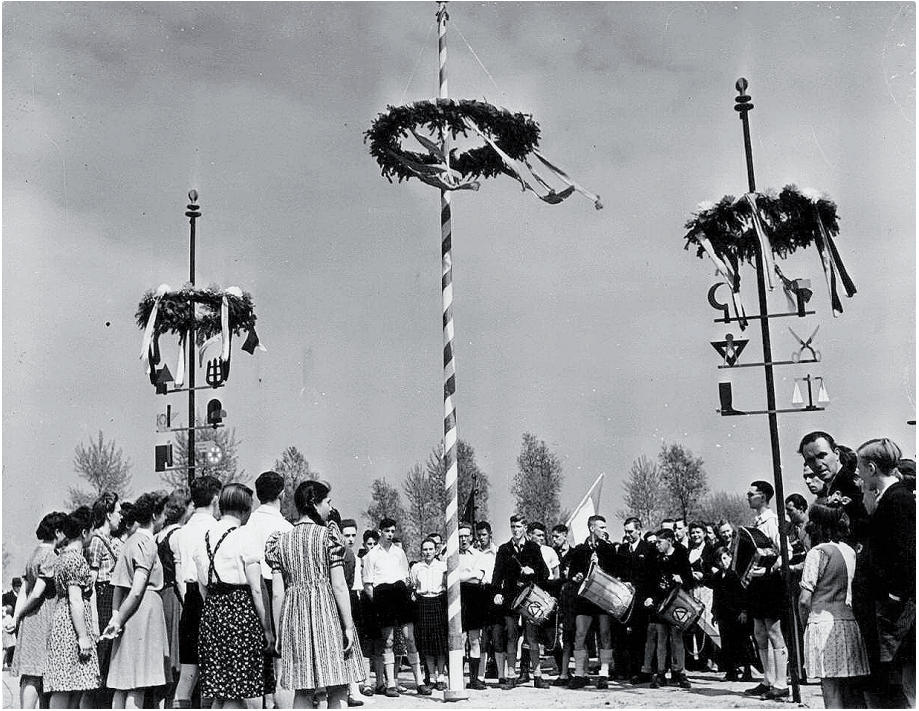
• Meifeest georganiseerd door het VIVO (Vlaams instituut voor volksdans en volksmuziek) te Gent op 18 mei 1941, met de traditionele meiboomplanting, volksliederen en volksdans.