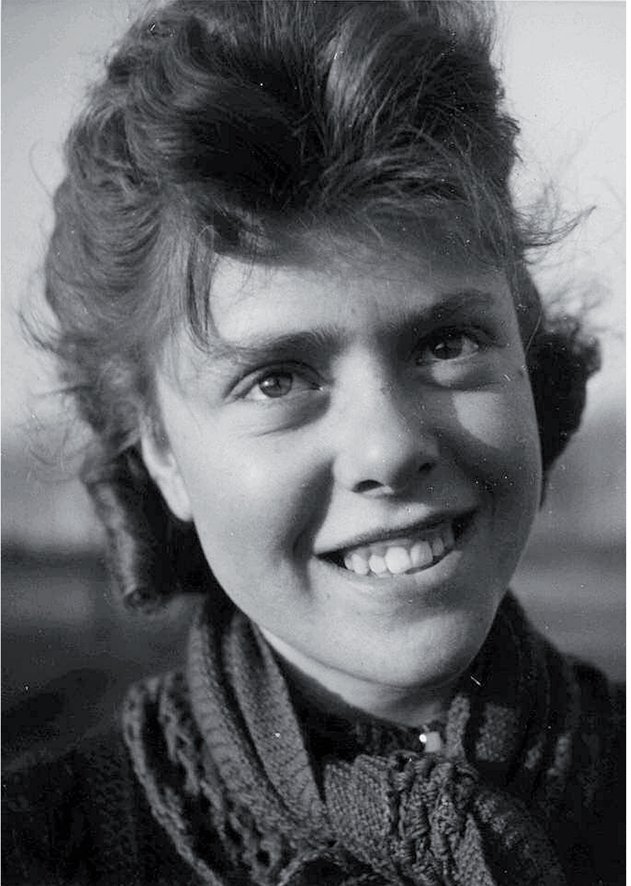
• Rassenkunde op zijn Vlaams : een boerin uit het Waasland.