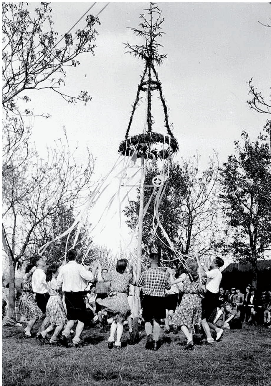
• Dansavond rond de meiboom in Torhout, georganiseerd door de Germaanse Werkgemeenschap Vlaanderen.