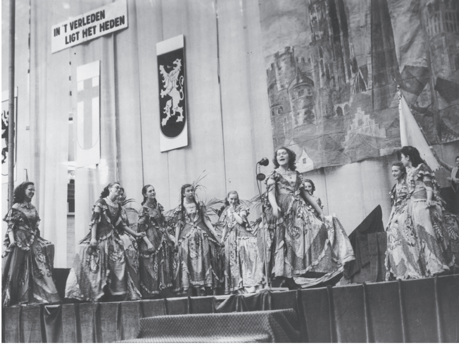
• Jubellanddag van de VKSJ (Vrouwelijke Katholieke Studerende Jeugd), Brussel, sportpaleis, 1949.

kwam daar ook het voorbeeld van de scoutsmethodiek en van de Blauwvoetretoriek bij 44 . In de vernieuwde Patronaten was hij degene die instond voor de uitwerking van een vooral uit het nationale verleden puttende romantiek. Hij was de bedenker van een hele reeks grote spelen waarin de historische gebeurtenissen, zoals de Guldensporenslag, de Boerenkrijg, de herovering van het Heilig Graf of de inname van Jeruzalem werden overgedaan. Veel beter dan droge uiteenzettingen zouden dergelijke spelen, aldus Aarts, in staat zijn “den held in den jongensziel wakker te schudden en hem kloek en sterk te maken” 45 . Door die spelen zouden zij immers, net zoals door het bezoeken van historische monumenten, sterker dan ooit beseffen de zonen van die roemrijke helden