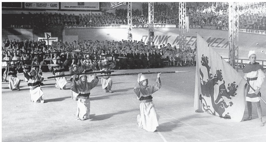
• Chiromanifestatie met opvallende reminiscenties aan middeleeuwse ridders, Sportpaleis te Gent, 1958.

pantheon werden in deze plechtigheden verwerkt, maar ook de heidense en aan de Wandervogel -mystiek herinnerende Zonnewende-feesten konden een aanleiding voor erfwachtafonden vormen. Uit het kampvuur dat bij zo'n Zonnewende-feest werd aangestoken, zag de voorzeger nogmaals de hele Dietse stamboom opdoemen, waarin de nationaal-socialistische jongeren hun plaats dienden in te nemen :