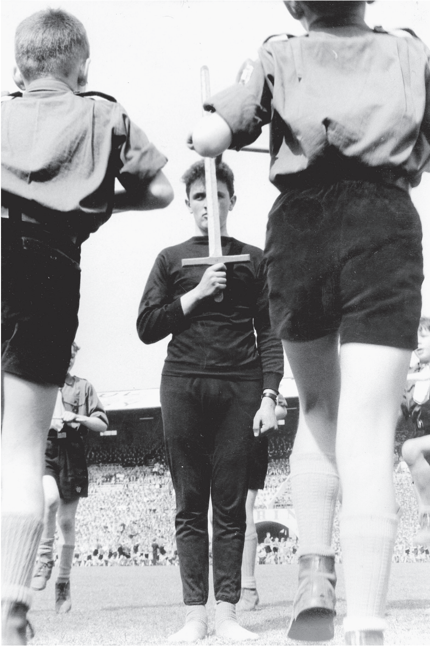
• "Burchtknepen" bij ridderspelen tijdens de Top '64 van de Chiro te Deurne op 24 mei 1964.