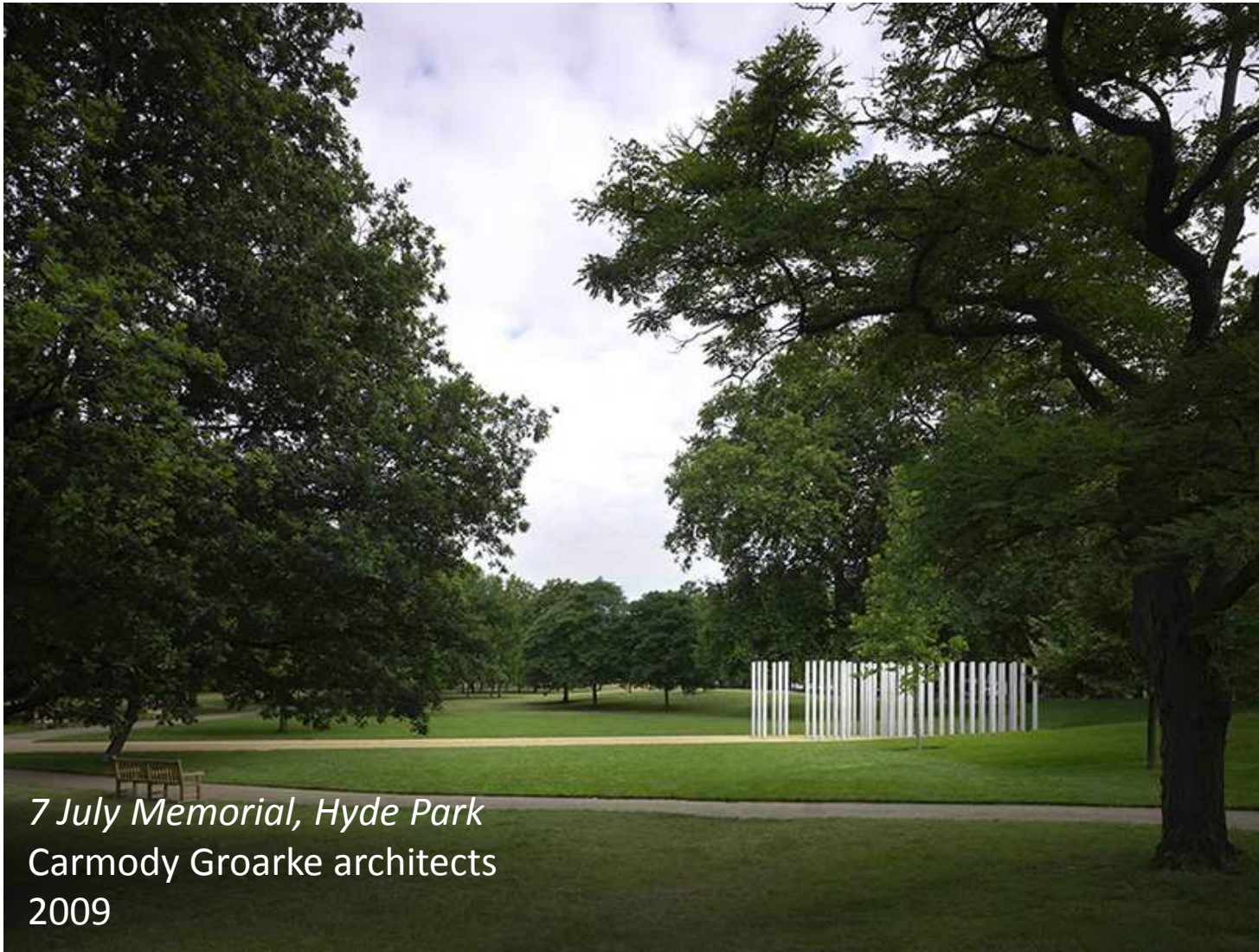
7 July Memorial, Hyde Park Carmody Groarke architects 2009