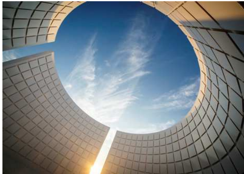
Memento (Borgloon) Wesley Meuris 2012