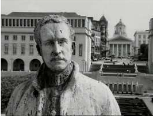
Sarah Vanagt, Little Figures (2003)