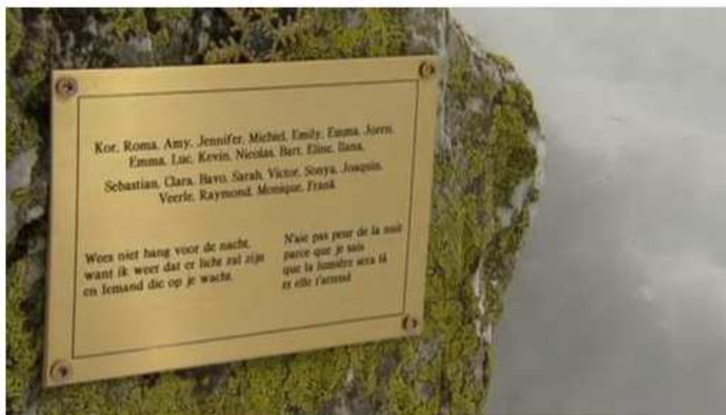
Het gedenkteken in Saint-Luc.